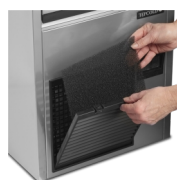
Kondensatorfilter er nemt at rengøre